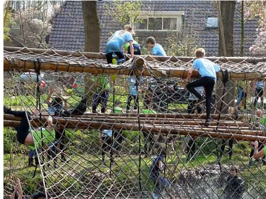
Iedereen wil graag schieten dus even wachten. Hierna wacht de grote Kraan hindernis over de schipbeek

Wat het voor iedereen leuk maakt is de goede sfeer onder de deelnemers en het enthousiasme dat ze mogen schieten. Vooral het glunderen van trots bij de jongsten, als ze raak schieten, is onbetaalbaar en de voornaamste reden waarom we dit doen als schietvereniging.