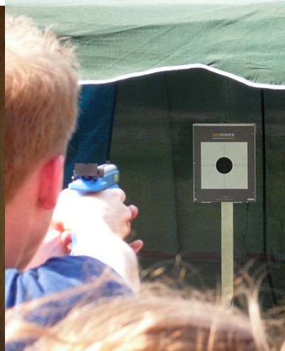
Het laser pistool.

Onze vrijwilligers moest goed in de gaten houden welke kleuren er langs komen. Zwarte en Rode wedstrijdlopers moeten namelijk zowiezo met de band over de "swing-over", de groenen en de grijzen mochten eerst schieten en als ze missen moeten ze er ook over. De blauwen hoeven alleen maar te schieten, voor hen geen strafhindernis.