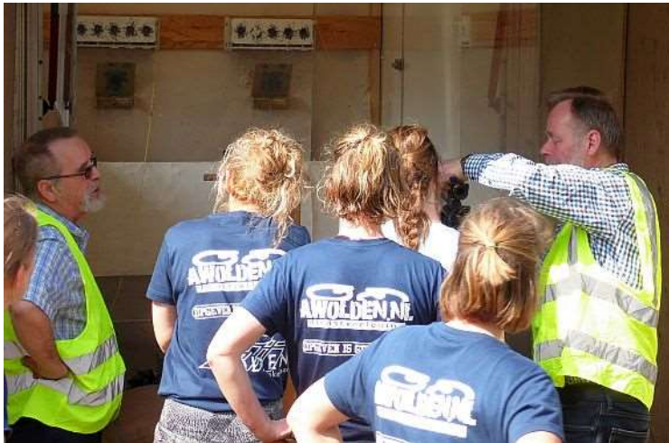
Met het geweer schieten op "Biathlon" doelen.