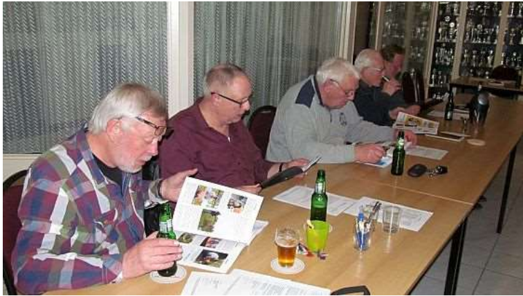
even het boekje doornemen