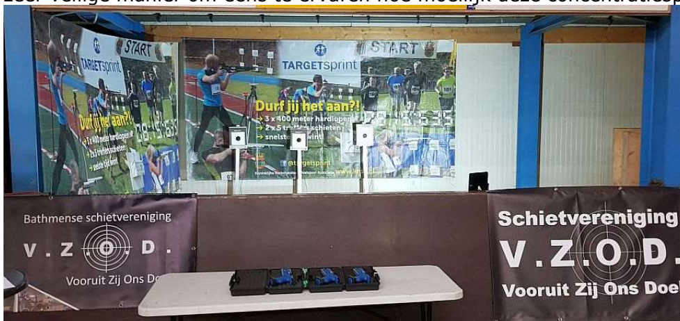
De opvallende stand van de VZOD

Afgelopen 17 november waren we weer present op de Winterfair in de manage om Sinterklaas binnen te halen. We staan altijd op een mooie plek om de schietsport te promoten. Dit keer hadden we de beschikking over drie laser pistolen. Een leuke, en zeer veilige manier om eens te ervaren hoe moeilijk deze concentratiesport is.