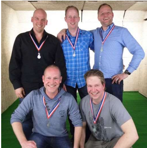
Derde: team Trigger Happy