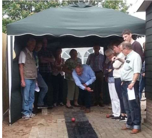
Net iets te hard gegooid ??