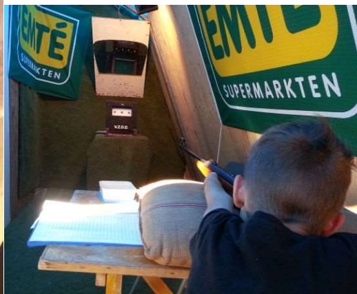
De favoriet van alle jeugdschutters en dan mama verrassen met het eten!

Natuurlijk zijn er weer vele prijzen te winnen. De kaartschutters hadden het soms wat makkelijk om de "losse" prijzen te winnen, er kom immers ook opgelegd geschoten worden en dat was zeker een uitkomst voor een heleboel schutters. De echte cracks schieten natuurlijk vanuit de geknielde schiethouding en alleen die dingen ook mee naar de bekens. Daarin hebben we twee klassen; Niet leden van de VZOD en Leden van de VZOD. Daarnaast is er een tombola met alle ingeleverde kaarten, hieruit wordt traditioneel de Rollade getrokken dit aangeboden wordt door de Emté Mensink, waarvoor wederom hartelijk dank. Ook alle karbonades op de karbonadebaan worden aangeboden door de Emté.