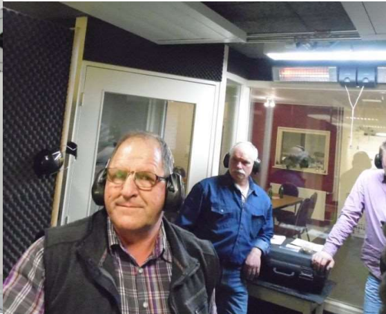
knipoog: hij dacht het al...