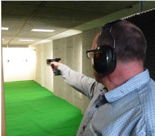
Schieten is gebeurd, wachten op de prijsuitreiking