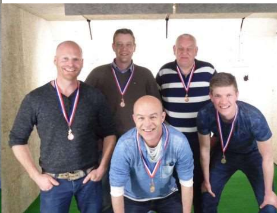
Tweede: Team Hooiweide