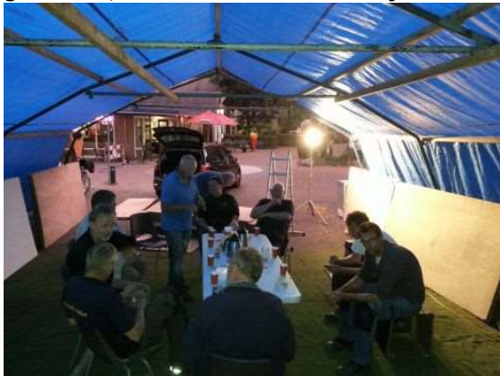
Koffiepauze nu in de tent tijdens de opbouw.

Nog even nagenieten van een prachtige Bathmense kermis dit jaar. Vooral op de zondag was het superweer en dan konden we ook merken in de schiettent. Dit jaar was het even spannend of onze locatie nog wel aanwezig zou zijn. De schuren achter de wereldwinkel zijn immers afgebroken en de inrichting van het schoolplein was tot voor kort in volle gang. Al snel bleek dat de parkeerplaats tot aan het hek hetzelfde zou blijven. Gelukkig krijgen volop medewerking van de wereldwinkel, zelfs een speciale stroomaansluiting is gemaakt, waarvoor onze hartelijke dank.