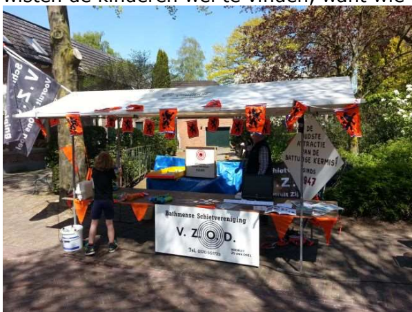
de kraam staat deels lekker in de schaduw

Vandaag stond de schietvereniging op de eerste lentemarkt in Bathmen. Omdat we al besloten hadden om met water te gaan spelen was het vandaag stralend lente weer. De markt was dan ook zeer geslaagd want het was superdruk. Ook de kraam van de VZOD wisten de kinderen wel te vinden, want wie wil nou niet met een supersoaker schieten!