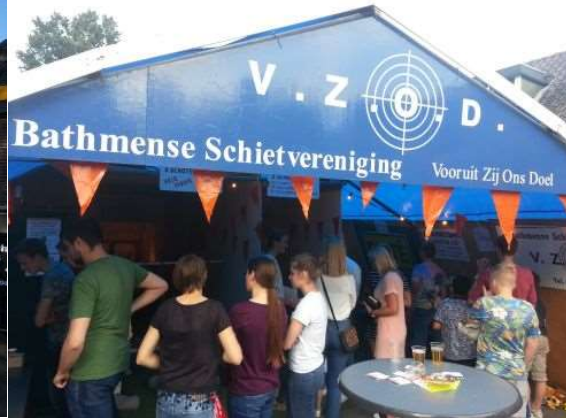
Gelijk een gezellige drukte in de tent