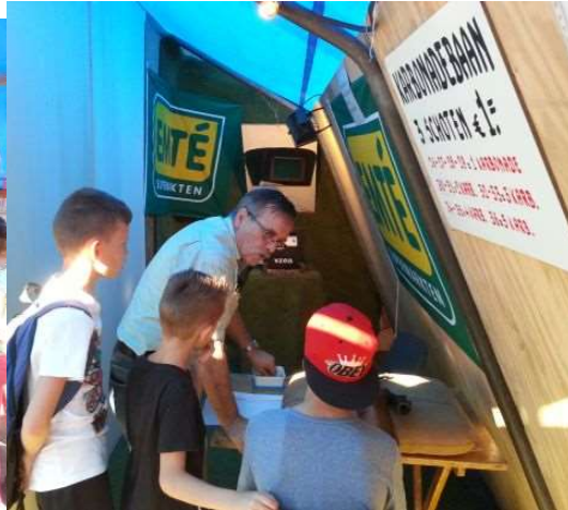
De kaartbaan liep goed en zeker ook weer de karbonade baan.