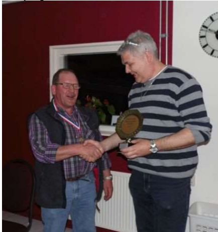
en de beker voor de 1e prijs!