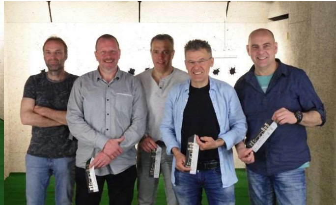
Vierde: Team de Windjes

Alle teams hartelijk dank voor de deelname en tot volgend jaar!