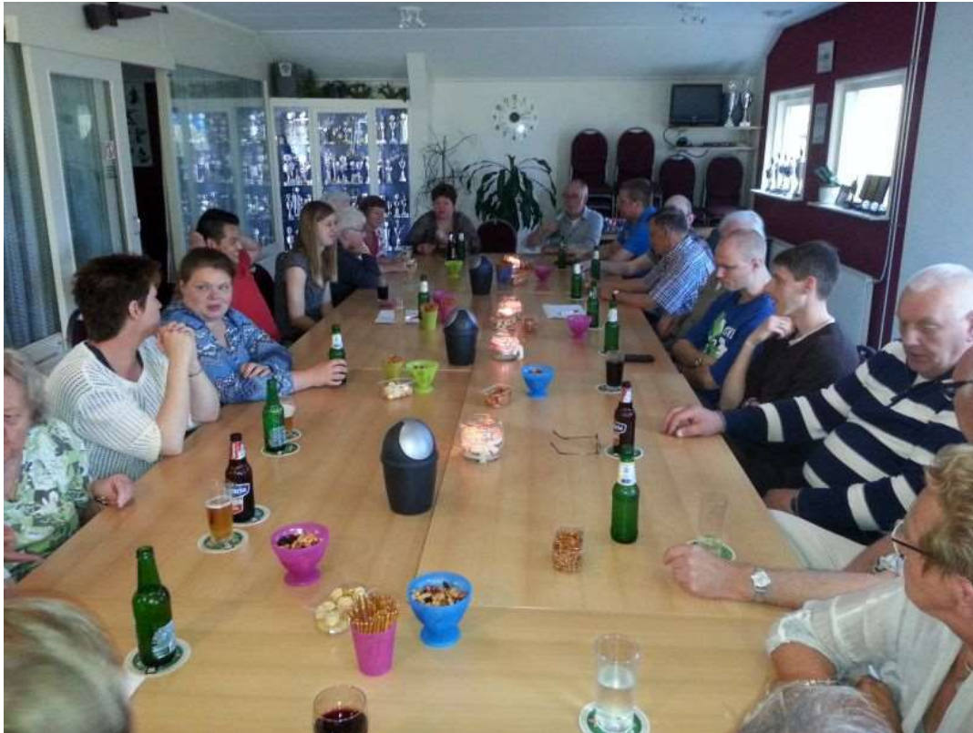
de zaal zit vol

Natuurlijk was er een activiteit gepland. Onder het schoteltje zat de team indeling, 3 teams moesten tegen elkaar strijden om de eer. Om te beginnen was er een soort kegelspel zonder kegels. De kunst was om voorzichtig een bal te gooien zodat die precies in het goede vak stil kwam te liggen. Dat bleek erg moeilijk omdat er veel te hard gegooid werd waardoor zelfs min punten werden gescoord. Maar het spel beviel zo goed dat er wel 3 rondes gegooid werden door de teams en de laatste beurt was voor allen een positieve score.