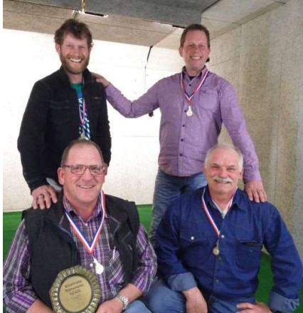
winnaar: Team Groot Dochteren (Jolanda ontbreekt)