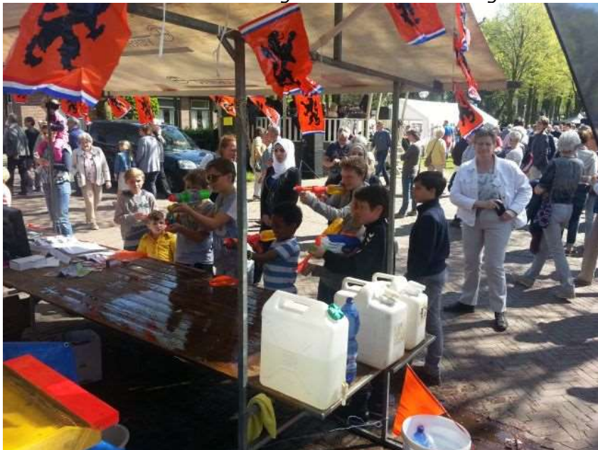
De volle lading door een hele batterij schutters

Al met al weer een leuke dag waar we ons gezicht weer hebben laten zien.