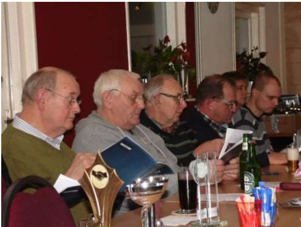
weer een mooi jaarboekje

In de pauze worden de jaarboekjes uitgereikt en betalen veel leden hun contributie bij de penningmeester. Ook werd de prijzentafel geplunderd. Net voor de pauze werden alle winnaars opgenoemd van de verschillende concoursen. Als vereniging hebben we het afgelopen jaar erg goed gedaan. Alleen maar 1 e en 2 e plaatsen voor alle klassen tijdens het regionaal concours is een prima score.