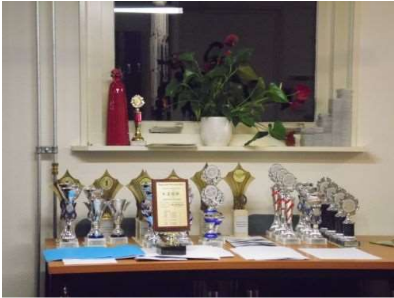
Te verdelen prijzen van de verschillende concoursen.

In de pauze worden de jaarboekjes uitgereikt en betalen veel leden hun contributie bij de penningmeester. Ook werd de prijzentafel geplunderd. Net voor de pauze werden alle winnaars opgenoemd van de verschillende concoursen. Als vereniging hebben we het afgelopen jaar erg goed gedaan. Alleen maar 1 e en 2 e plaatsen voor alle klassen tijdens het regionaal concours is een prima score.