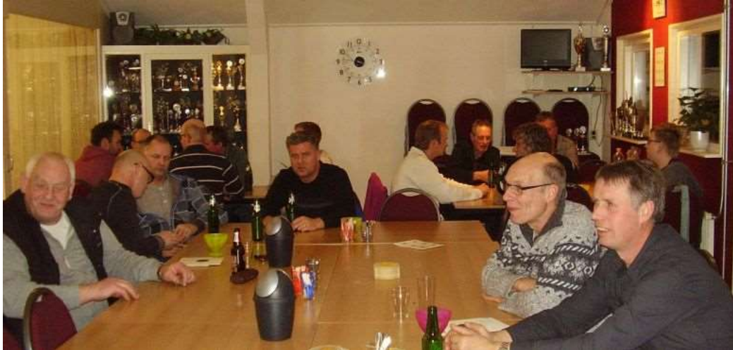
Weer 4 teams die deze avond meedoen.

Elk team krijgt 4 geweer en 3 pistoolkaarten waarvan de 3 en 1 beste meetellen.