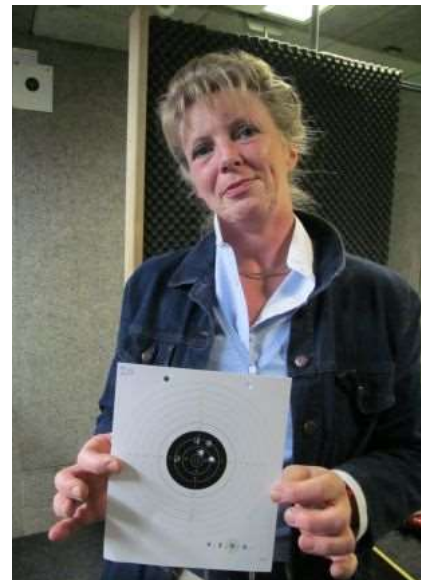
Talent uit Laren