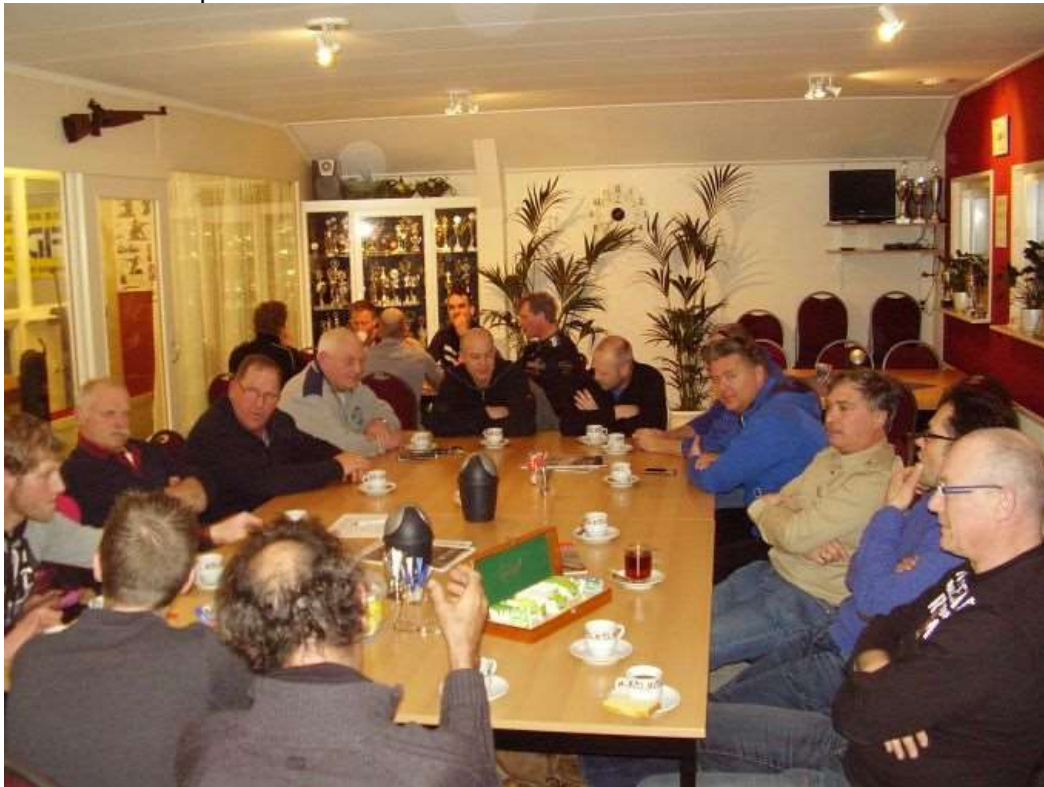
Iedereen zit klaar om te beginnen.

De finale! Met de 4 top teams die boven zijn komen drijven in de competitie met 21 teams. Op zich ben je dan al een winnaar maar er kan er maar 1 winnen en dat wordt deze avond bepaald.