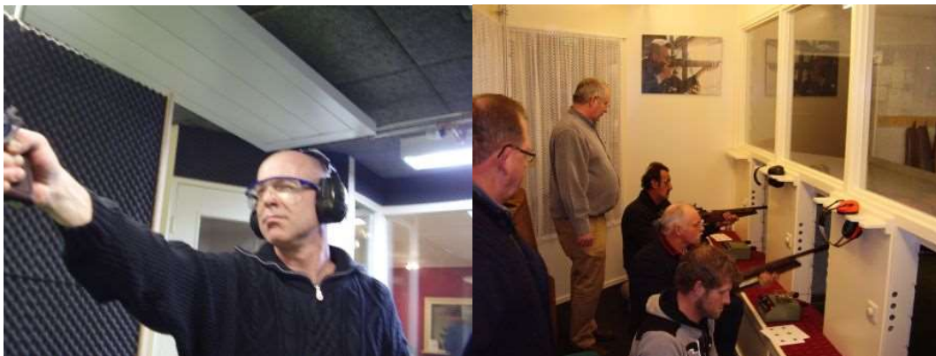
Plezier staat voorop. Even lekker schieten en dan een versnapering!

Ditmaal zijn het (bijna) allemaal ervaren schutters dus de hulp op de pistoolbaan is minimaal maar soms broodnodig. Natuurlijk helpt de captain waar hij kan.