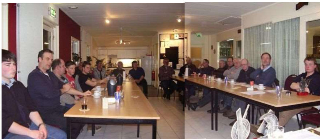
Een blik vanaf de bestuurstafel