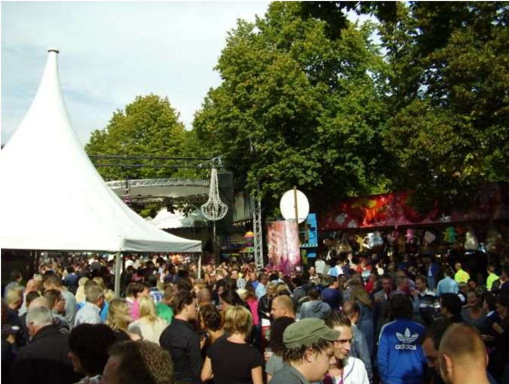
Een spaarzaam zonnig moment op de kermis