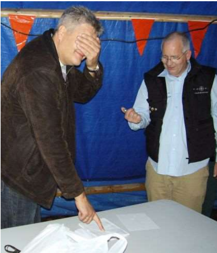
Dit is de winnaar van de rollade !