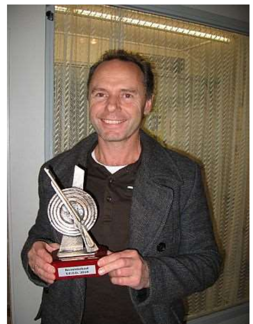
winnaar Jan Pladet

De Rollade, die getrokken werd uit alle verschoten kaarten, werd ditmaal gewonnen door Sonja Lubberts uit Twello. Ze mag binnenkort de 2,5 kg zware rollade ophalen bij de Emte in Bathmen die