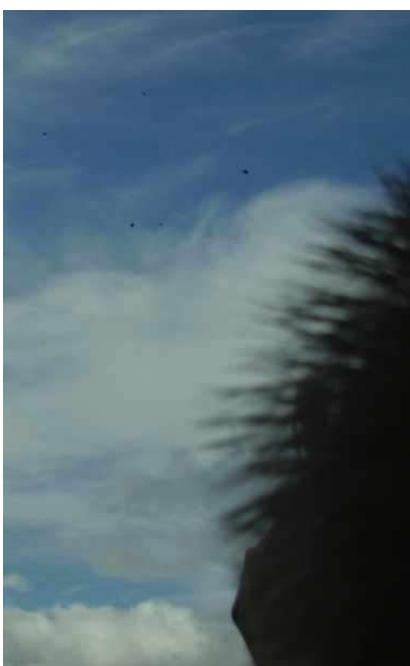
een duif in 4 stukken